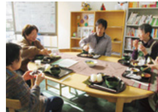
▲みんなでランチを囲んで楽しくおしゃべり