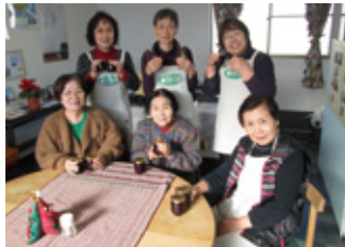
▲ジャム作り教室でジャムを自作しました