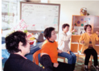
▲いきいき体操で皆健康を目指しています