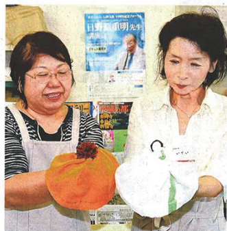
ぼんぼんを付けたり人形を付けるなど工夫した、シルバーカフェオリジナル帽子

高齢者地域支援会らと活動するシルバーカフェ（松本市沢村3丁）で、タオル帽子を作り、病院や施設へ贈ろうとプロジェクトが本格化した。タオル帽子は、がん患者の髪を剃る際の冷感対策として、デザイン性をプラスしたシルバーカフェオリジナルでも登場。贈って喜ばれるだけでなく、「小さな社会貢献」と活動にやりがいを見いだしている。（八代啓之）