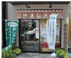
のぼり旗が目印です

シルバーカフェオリジナル 大切な人にありがとうを伝えたい ハッピーエンディングノート 2冊セット / 2,100円 店舗内で販売中