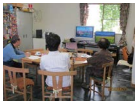
楽しく皆で歌声カフェ