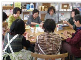
同世代で楽しくおしゃべり