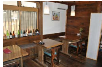
約20人がご利用頂けます